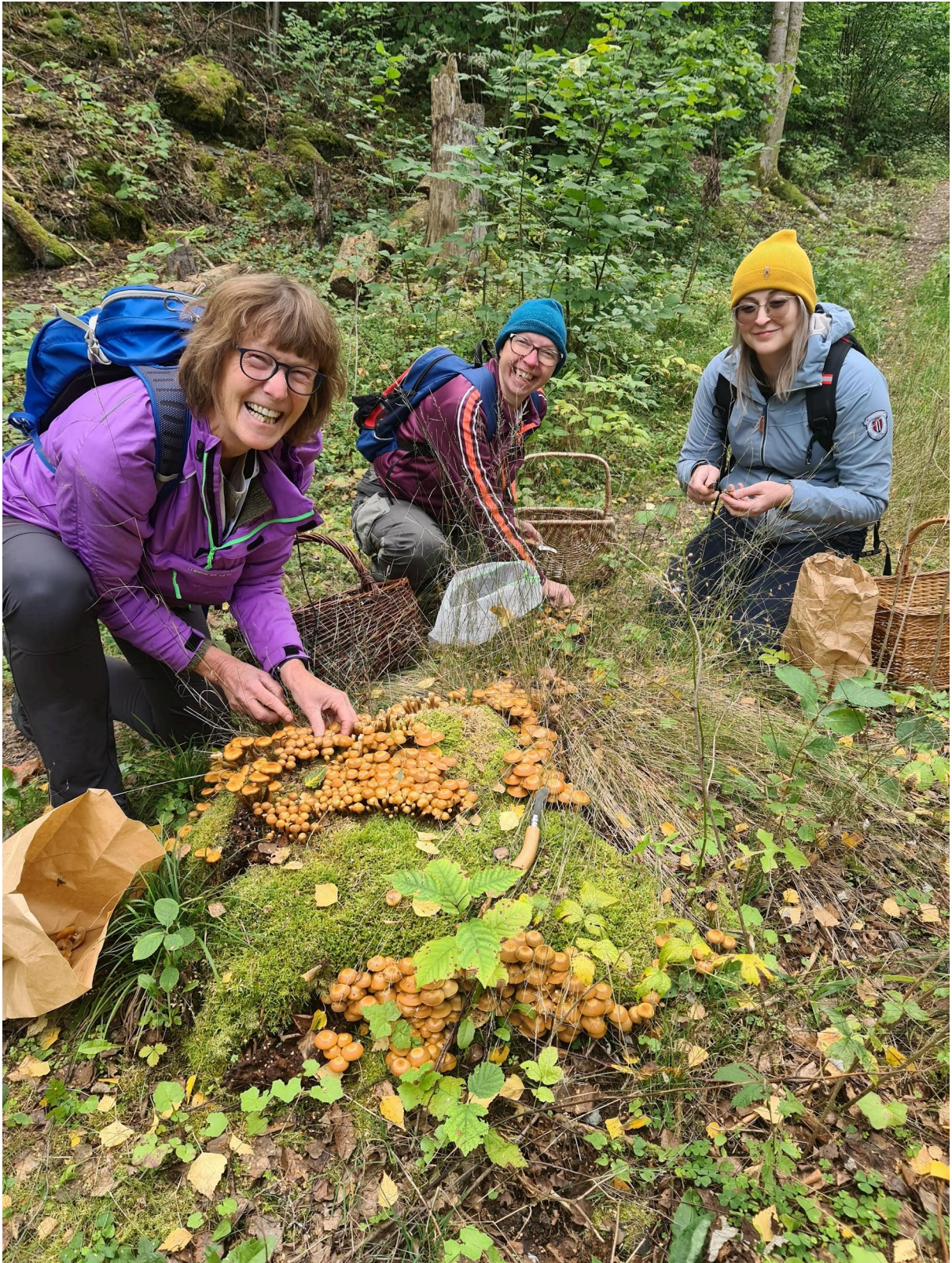
Her var det stubbeskjellsopp nok til alle