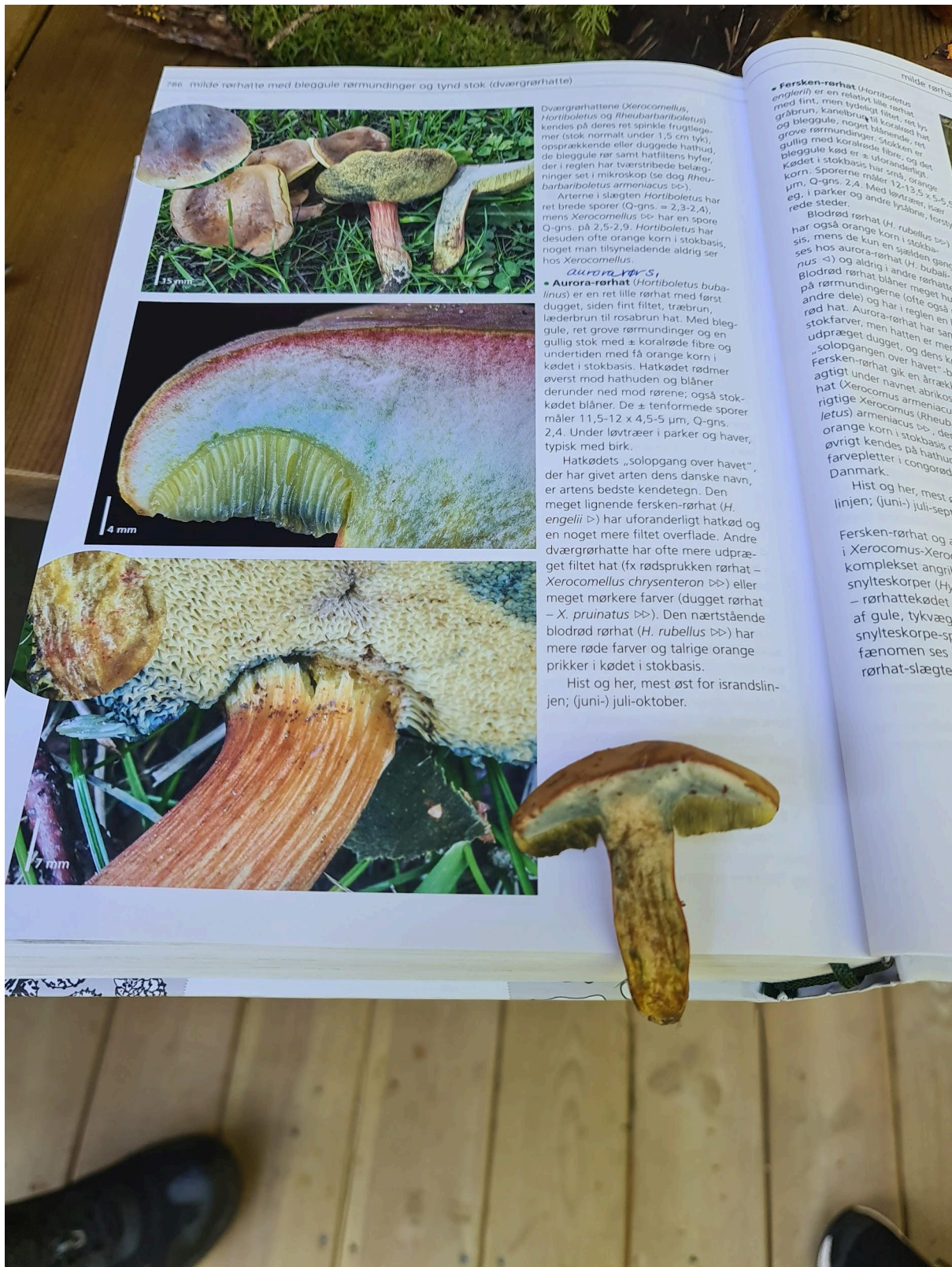
Et spennende funn, Aurorarørsopp