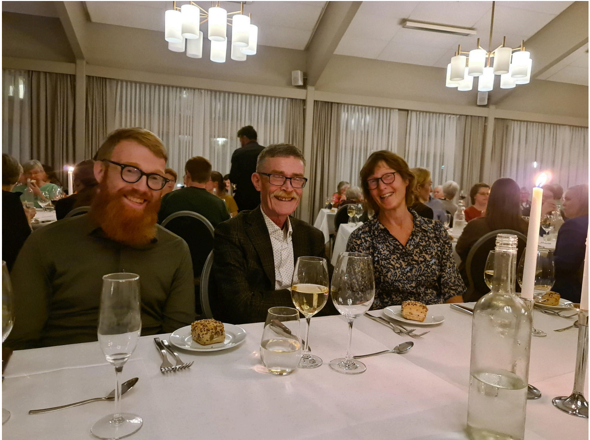
Festmiddag på lørdag