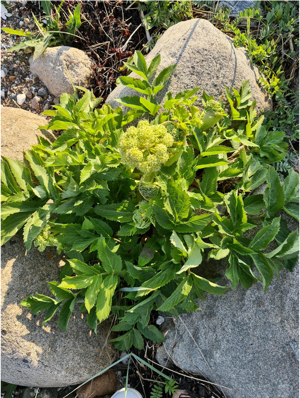
Strandkvann. Fra turen til Saltø.