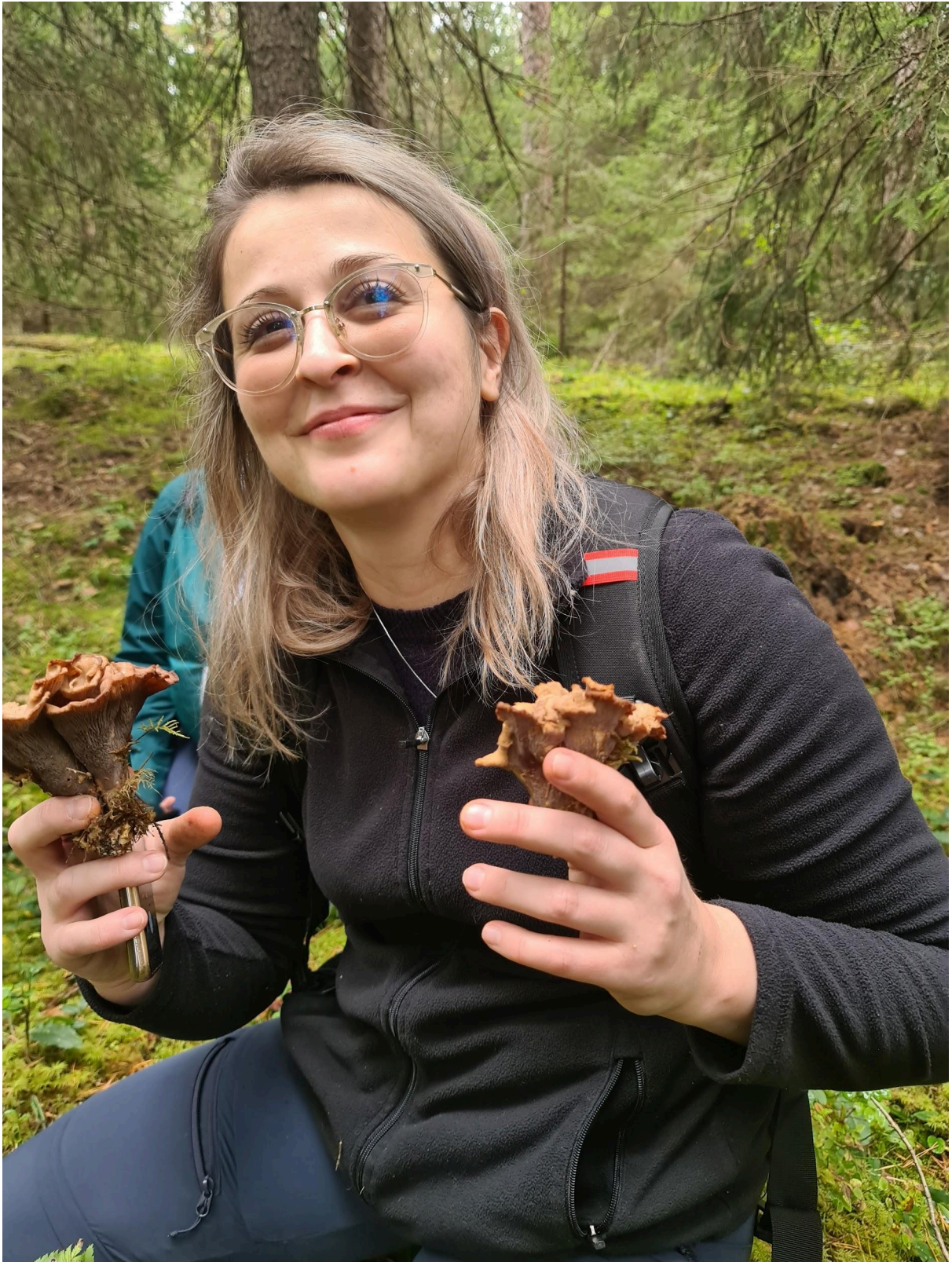
Madina og fiogubben